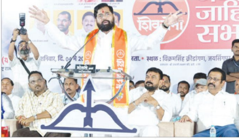
जयसिंगपूर महायुतीचे उमेदवार खासदार धैर्यशील माने यांच्या प्रचाराय आयोजित सभेत बोलताना मुख्यमंत्री एकनाथ शिंदे शेजारी व्यासपीठावर इतर मान्यवर.

मह्युतीचे सकार दोन्ही हाताने देणार आहे. मात्र यापूर्वीचे सकार देणार नव्हते तर घेणार होते. घात बसून फेसबुकद्वारा सकार चालत नाही. तर सर्वसामान्य जनतेत मिसळून काम करणारे सकार असावे लागते. आमचे सकार संपत्तीच्या जनतेत मिसळून काम करत आहे. त्यामुळे राख्याचा विकास मोठ्या प्रमाणात होत आहे. या सरकारने शिरोळ तालुक्याला विकाससाठी मोठा निधी दिला आहे. येत्या काळात आपल्या विकास कार्याचा अंशाल तर तुम्ही आपला मताच्या रूपाने दान द्या, आम्ही शिरोळ