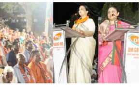
योजना, सुकन्या योजना, प्रधानमंत्री