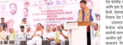
झालेल्या सभेत केले.