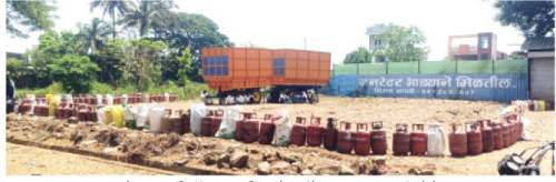
मुरुगूडमध्ये शुक्रवारी गॅस एजन्सी समोर रांगेत ताटकळत थांबलेले ग्राहक.

घटना टाळण्यासाठी प्रशासनाने व पोलीस विभागाने येथील हल्लेबाज पर्यटकांवर योग्य कारवाई करण्याची गरज आहे. जर अशा अंकुश ठेवण्यात आला तर पर्यटकांकडून जीवावर बेतणारी धाडस टाकले जाईल.